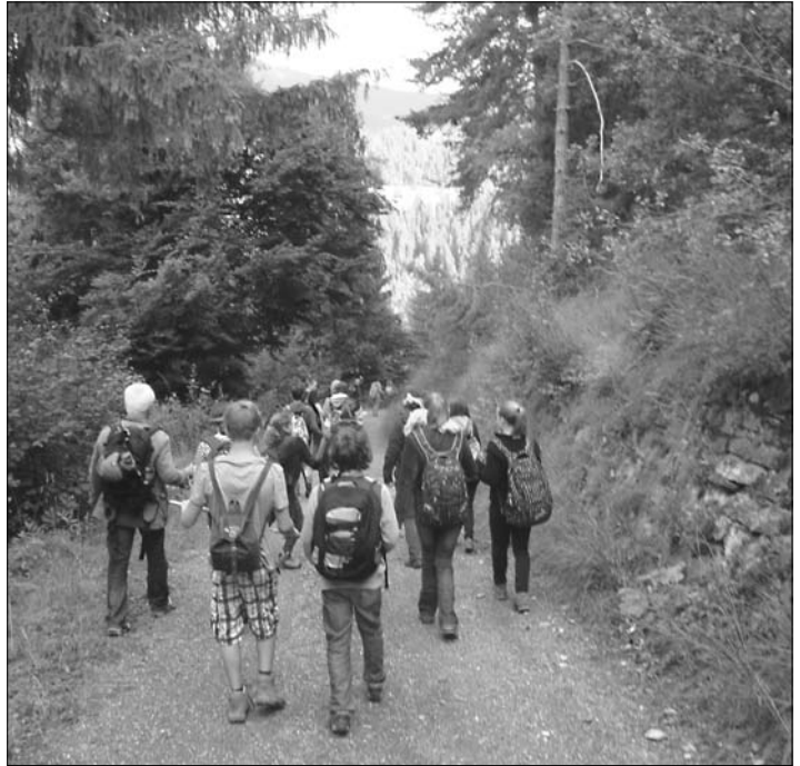
Kirchenwanderung durch die Rheinschlucht

Egal, was ich tue oder wohin ich gehe ich werde immer von dir geführt sein. Und wenn ich auch blind umherirre, wirst du mich führen. Hilf mir selbst andere Personen auf ihrem Weg zu führen. So sollen mich führen auf meinem Weg Eltern, Freunde und Gott.