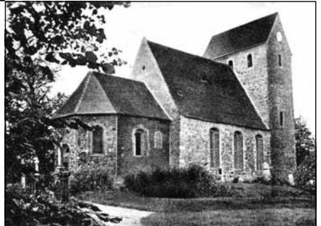
Sandersdorf bei Bitterfeld

Wir haben weitere Postkarten-Grüsse erhalten: