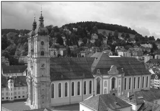
Kathedrale St. Gallen