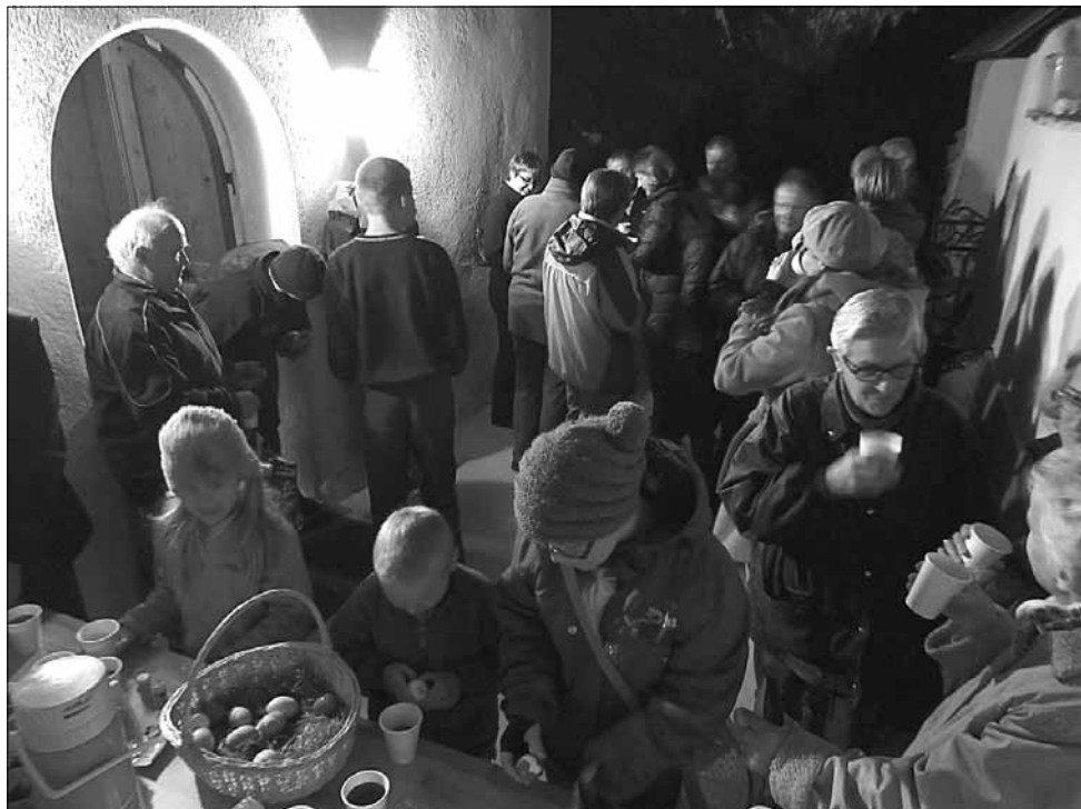
Eiertütschen nach der Osternachtfeier in Safien Neukirch vom 19. April