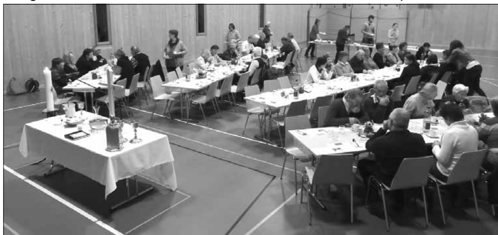
Essgottesdienst in Safien Platz - Mehrzweckhalle vom 17. April