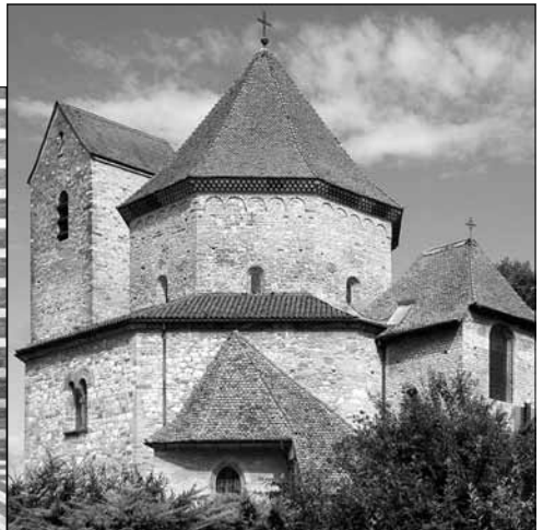
Abteikirche in Ottmarsheim (Elsass) mitte 11. Jahrhundert