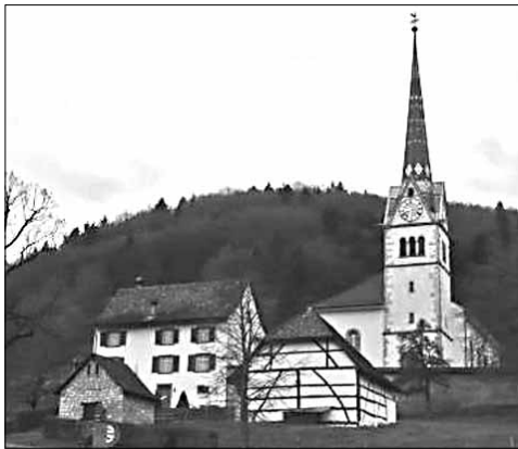
Merishausen bei Schaffhausen