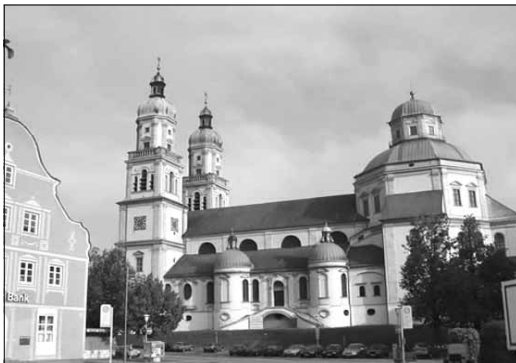
Lorenzkirche Kempten D