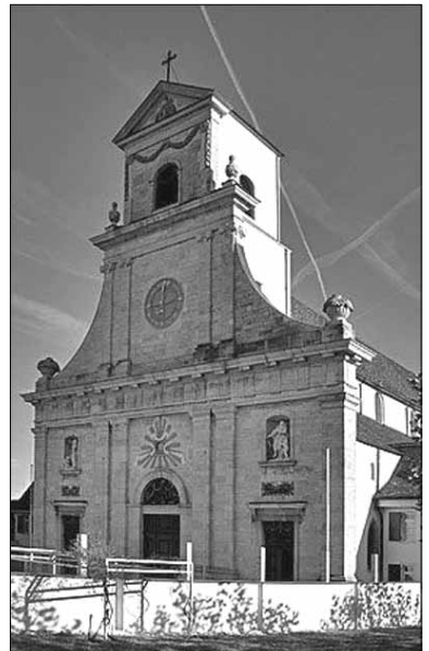
Mariastein bei Basel