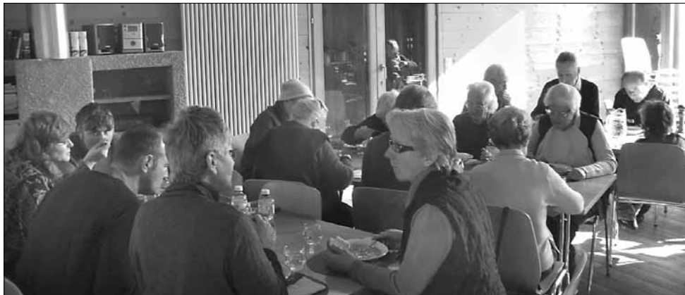
Gemütliches Beisammen sein am Suppenonntag in Versam