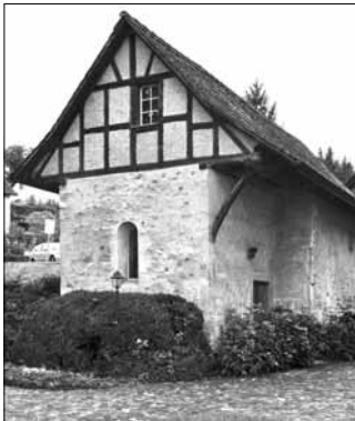
obere Kirche Regensdorf